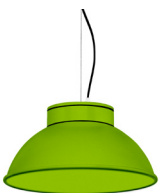
19: RAL 6018 Verde Amarillento texturado