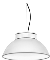
1: RAL9010 Blanco Puro texturado