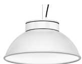
10: RAL9010 Blanco Puro texturado