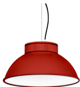
16: RAL 3000 Rojo Vivo texturado 10: RAL9010 Blanco Puro texturado