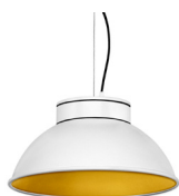
1: RAL9010 Blanco Puro texturado 30: Dorado