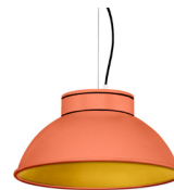
15: RAL 2012 Naranja Salmón texturado 30: Dorado