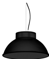
2: RAL9005 Negro Oscuro texturado