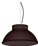
22: RAL 8016 Caoba texturado