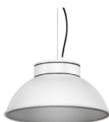
2: RAL9005 Negro Oscuro texturado 50: Plateado