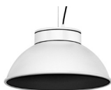
20: RAL9005 Negro Oscuro texturado