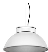
2: RAL9005 Negro Oscuro texturado 50: Plateado