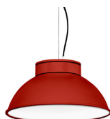
16: RAL 3000 Rojo Vivo texturado 10: RAL9010 Blanco Puro texturado