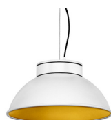
1: RAL9010 Blanco Puro texturado 30: Dorado