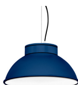
18: RAL 5003 Azul Zafiro texturado 10: RAL9010 Blanco Puro texturado