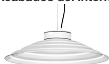
10: RAL9010 Blanco Puro texturado