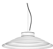
1: RAL9010 Blanco Puro texturado