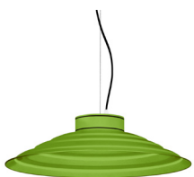
19: RAL 6018 Verde Amarillento texturado