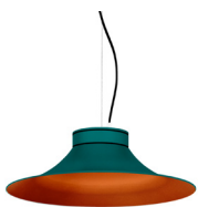
20: RAL 6000 Verde Patina texturado 40: Cobre