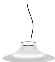
1: RAL9010 Blanco Puro texturado