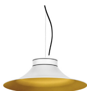
1: RAL9010 Blanco Puro texturado 30: Dorado