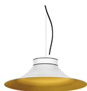
1: RAL9010 Blanco Puro texturado 30: Dorado