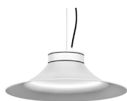
10: RAL9010 Blanco Puro texturado