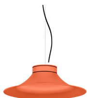
15: RAL 2012 Naranja Salmón texturado