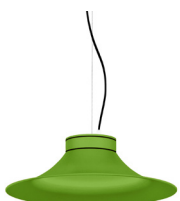
19: RAL 6018 Verde Amarillento texturado