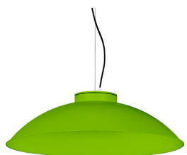
19: RAL 6018 Verde Amarillento texturado