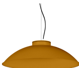
21: RAL 8001: Pardo Ocre texturado