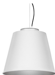
2: RAL9005 Negro Oscuro texturado 50: Plateado