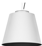
20: RAL9005 Negro Oscuro texturado