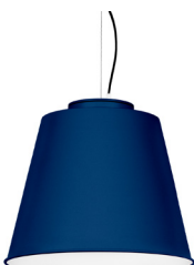
18: RAL 5003 Azul Zafiro texturado 10: RAL9010 Blanco Puro texturado