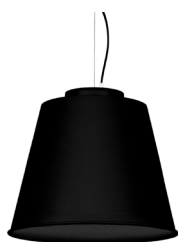
2: RAL9005 Negro Oscuro texturado