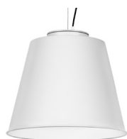
10: RAL9010 Blanco Puro texturado