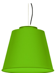
19: RAL 6018 Verde Amarillento texturado