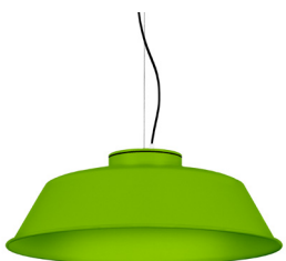
19: RAL 6018 Verde Amarillento texturado