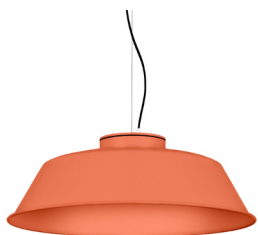
15: RAL 2012 Naranja Salmón texturado