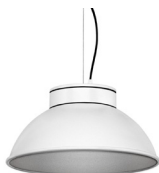
2: RAL9005 Negro Oscuro texturado 50: Plateado