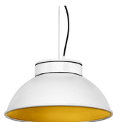
1: RAL9010 Blanco Puro texturado 30: Dorado