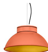
15: RAL 2012 Naranja Salmón texturado 30: Dorado