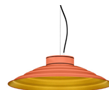
15: RAL 2012 Naranja Salmón texturado 30: Dorado