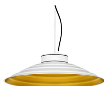
1: RAL9010 Blanco Puro texturado 30: Dorado