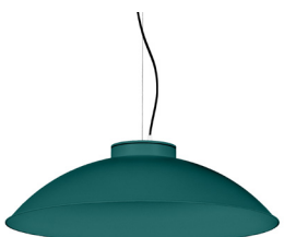
20: RAL 6000 Vert Patine texturé