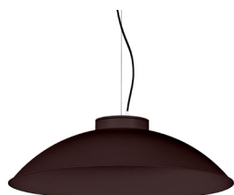
22: RAL8016 Brun Acajou texturé