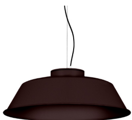
22: RAL8016 Brun Acajou texturé