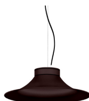
22: RAL8016 Brun Acajou texturé