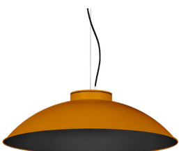
21: RAL 8001: Brun terre de Sienne texturé 20: RAL9005 Noir Foncé texturé