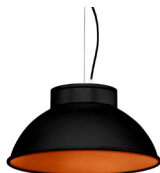
2: RAL9005 Noir Foncé texturé 40: Cuivre