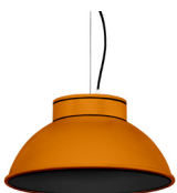
21: RAL 8001: Brun terre de Sienne texturé 20: RAL9005 Noir Foncé texturé