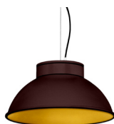
22: RAL8016 Brun Acajou texturé 30: Doré