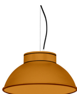
21: RAL 8001: Brun terre de Sienne texturé