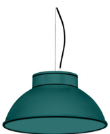
20: RAL 6000 Vert Patine texturé