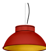
16: RAL 3000 Rouge Feu texturé 30: Doré