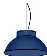
18: RAL 5003 Bleu Saphir texturé