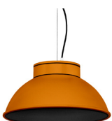
21: RAL 8001: Brun terre de Sienne texturé 20: RAL9005 Noir Foncé texturé