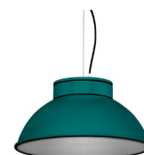
20: RAL 6000 Vert Patine texturé 50: Argenté