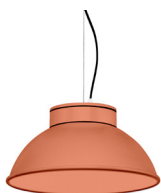
15: RAL 2012 Orangé Saumon texturé