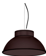
22: RAL 8016 Brun Acajou texturé