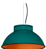
20: RAL 6000 Vert Patine texturé 40: Cuivre