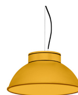
14: RAL 1037 Jaune Soleil texturé