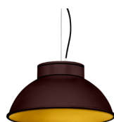
22: RAL8016 Brun Acajou texturé 30: Doré