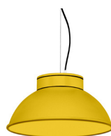
13: RAL 1023 Jaune signalisation texturé