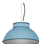
17: RAL 5024 Bleu Pastel texturé 50: Argenté