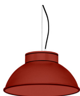
16: RAL 3000 Rouge Feu texturé