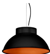
2: RAL9005 Noir Foncé texturé 40: Cuivre