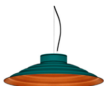
20: RAL 6000 Vert Patine texturé 40: Cuivre