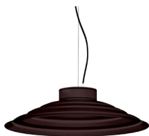
22: RAL8016 Brun Acajou texturé