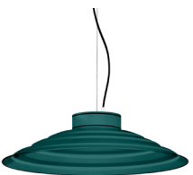
20: RAL 6000 Vert Patine texturé