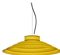
13: RAL 1023 Jaune signalisation texturé