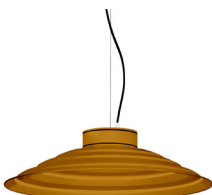
21: RAL 8001: Brun terre de Sienne texturé