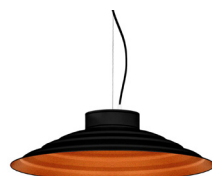
2: RAL9005 Noir Foncé texturé 40: Cuivre