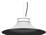
20: RAL9005 Noir Foncé texturé