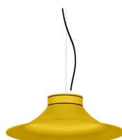
13: RAL 1023 Jaune signalisation texturé