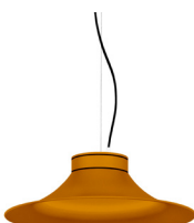
21: RAL 8001: Brun terre de Sienne texturé