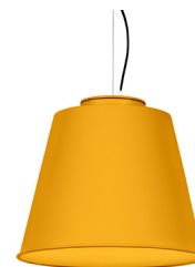
14: RAL 1037 Jaune Soleil texturé