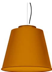
21: RAL 8001: Brun terre de Sienne texturé