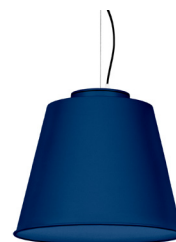
18: RAL 5003 Bleu Saphir texturé