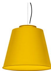
13: RAL 1023 Jaune signalisation texturé