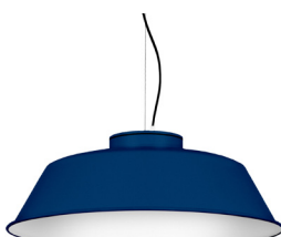
18: RAL 5003 Bleu Saphir texturé 10: RAL9010 Blanc Pur texturé