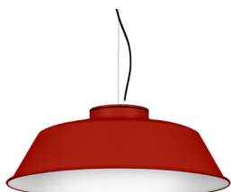
16: RAL 3000 Rouge Feu texturé 10: RAL9010 Blanc Pur texturé