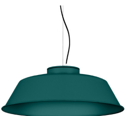
20: RAL 6000 Vert Patine texturé