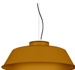
21: RAL 8001: Brun terre de Sienne texturé