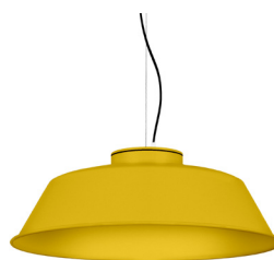
13: RAL 1023 Jaune signalisation texturé