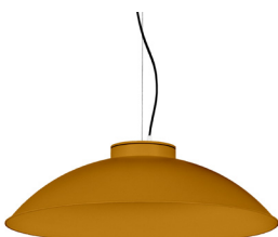
21: RAL 8001: Brun terre de Sienne texturé