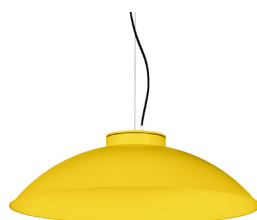
13: RAL 1023 Jaune signalisation texturé