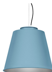
17: RAL 5024 Bleu Pastel texturé 50: Argenté