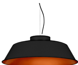
2: RAL9005 Noir Foncé texturé 40: Cuivre