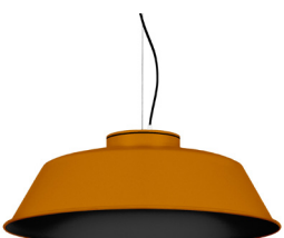
21: RAL 8001: Brun terre de Sienne texturé 20: RAL9005 Noir Foncé texturé