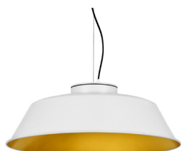
1: RAL9010 Blanc Pur texturé 30: Doré