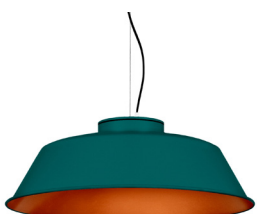
20: RAL 6000 Vert Patine texturé 40: Cuivre