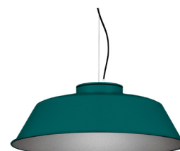
20: RAL 6000 Vert Patine texturé 50: Argenté