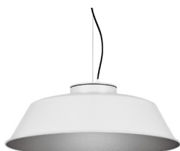
2: RAL9005 Noir Foncé texturé 50: Argenté