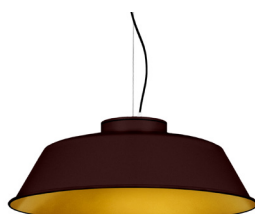
22: RAL8016 Brun Acajou texturé 30: Doré