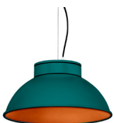
20: RAL 6000 Vert Patine texturé 40: Cuivre