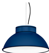
18: RAL 5003 Bleu Saphir texturé 10: RAL9010 Blanc Pur texturé