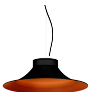
2: RAL9005 Noir Foncé texturé 40: Cuivre