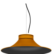
21: RAL 8001: Brun terre de Sienne texturé 20: RAL9005 Noir Foncé texturé