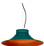
20: RAL 6000 Vert Patine texturé 40: Cuivre