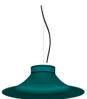
20: RAL 6000 Vert Patine texturé