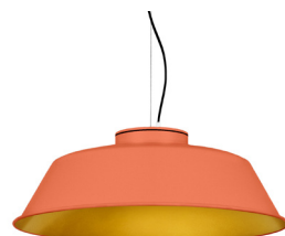
15: RAL 2012 Orangé Saumon texturé 30: Doré