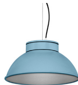
17: RAL 5024 Bleu Pastel texturé 50: Argenté