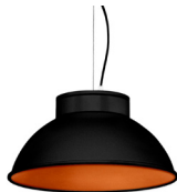
2: RAL9005 Noir Foncé texturé 40: Cuivre