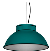
20: RAL 6000 Vert Patine texturé 50: Argenté