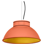
15: RAL 2012 Orangé Saumon texturé 30: Doré