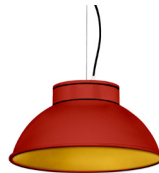
16: RAL 3000 Rouge Feu texturé 30: Doré