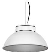
2: RAL9005 Noir Foncé texturé 50: Argenté