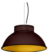
22: RAL8016 Brun Acajou texturé 30: Doré