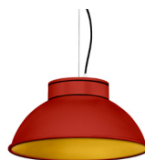
16: RAL 3000 Rouge Feu texturé 30: Doré