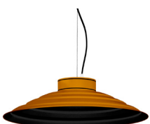
21: RAL 8001: Brun terre de Sienné texturé 20: RAL9005 Noir Foncé texturé