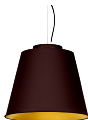
22: RAL8016 Brun Acajou texturé 30: Doré