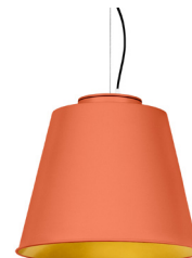
15: RAL 2012 Orangé Saumon texturé 30: Doré