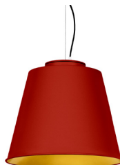
16: RAL 3000 Rouge Feu texturé 30: Doré