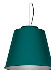
20: RAL 6000 Vert Patine texturé 50: Argenté