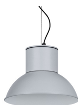
07: RAL 9006 Weißszlig;aluminium