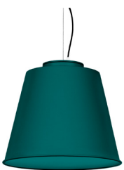
20: RAL 6000 Vert Patine texturé