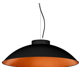
2: RAL9005 Noir Foncé texturé 40: Cuivre