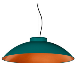
20: RAL 6000 Vert Patine texturé 40: Cuivre