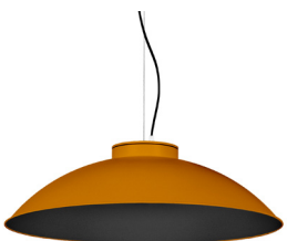
21: RAL 8001: Brun terre de Sienne texturé 20: RAL9005 Noir Foncé texturé